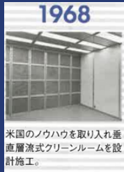
1968 米国のノウハウを取り入れ垂 直直流式クリーンルームを設 計施工。