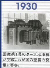
1930 国産第1号のターボ冷凍機 が完成。わが国の空調の発 展に寄与。