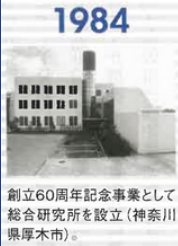
1984 創立60周年記念事業として 総合研究所を設立(神奈川県 厚木市)。