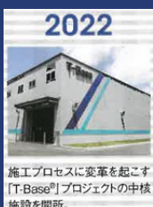
2022 施工プロセスに変革を起こす 「T-Base®」プロジェクトの中核 施設を開所。