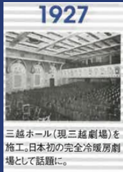
1927 三越ホール(現三越劇場)を 施工。日本初の完全冷暖房劇 場として話題に。