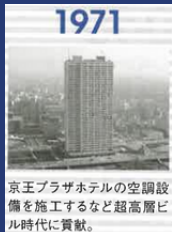
1971 京王プラザホテルの空調設 備を施工するなど超高層ビ ル時代に貢献。