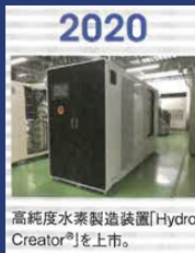
2020 高純度水素製造装置「Hydro Creator®」を上市。